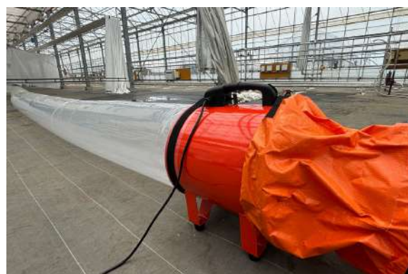
▲奥行方向に穴あきダクトを設置

アウトサイダーは100V電源で動作する簡易外気導入システムです。外気を均一にハウス内に導入することで、ハウス外へ向けて空気の流れを作り出し、高温時のハウス内環境を改善します。